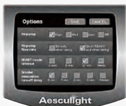
■操作は本体モニターから、スピーディーに設定が可能。

吸煙の時間やタイミングを選択することができるので、煙によって院内の環境を損ねることがありません。