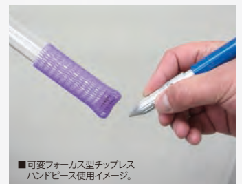
■可変フォーカス型チップレスハンドピース使用イメージ。