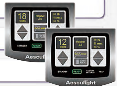
■各種設定が可能なモニタリングシステム