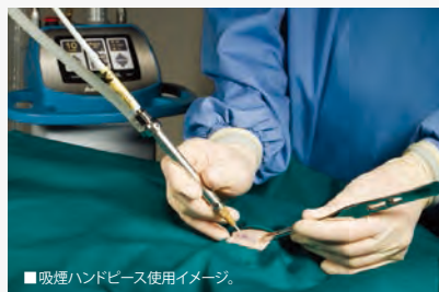
■吸煙ハンドピース使用イメージ。